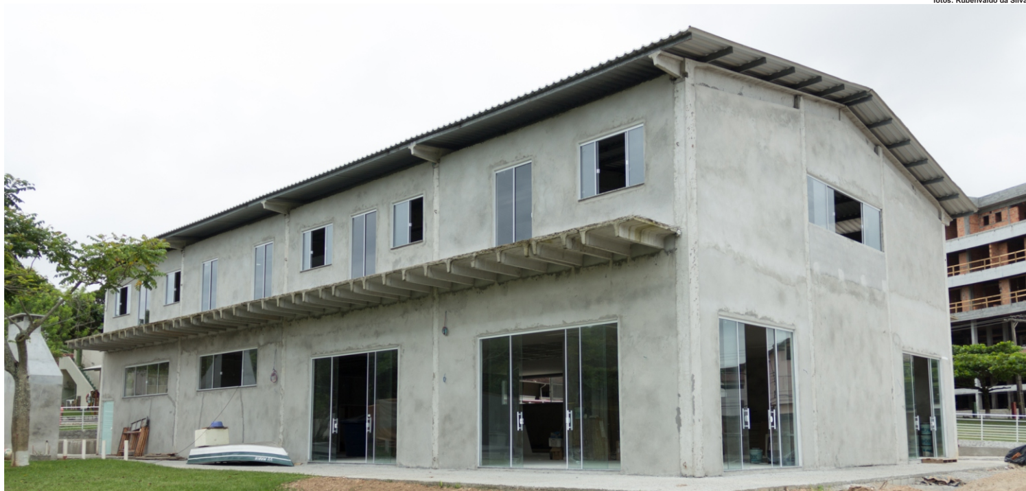
Falta pouco para a Afalesc concluir as obras da nova Sede Praiana nos Ingleses. Um novo espaço para os associados e campistas